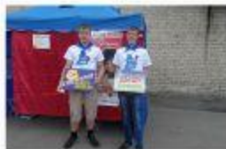
Туринск, 2015г. Экспресс-тестирование на ВИЧ. Выставка