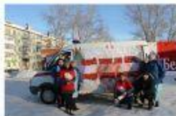
Североуральск. 2015г. Экспресс-тестирование на ВИЧ