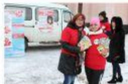
Полеской. 2015г. Экспресс-тестирование на ВИЧ. Выставка