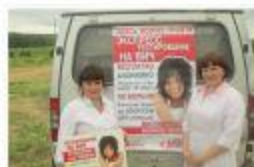
Каменик-Уральский. 2015г. Экспресс-тестирование на ВИЧ