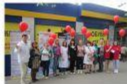
Серов. 2015г. Экспресс-тестирование на ВИЧ. Выставка