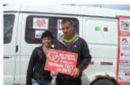
Новая Елка. 2015г. Экспресс-тестирование на ВИЧ. Выставка