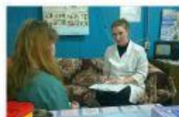
Урбит. 2015г. Экспресс-тестирование на ВИЧ. Выставка