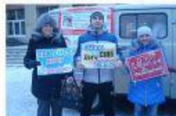
Суйок. 2015г. Экспресс-тестирование на ВИЧ. Выставка