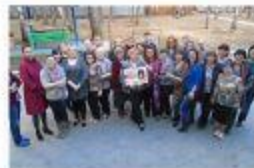
Областной семинар_Обзор лучших практик в организации ЭТ в муниципалитете В Сыктывкар. 2015г